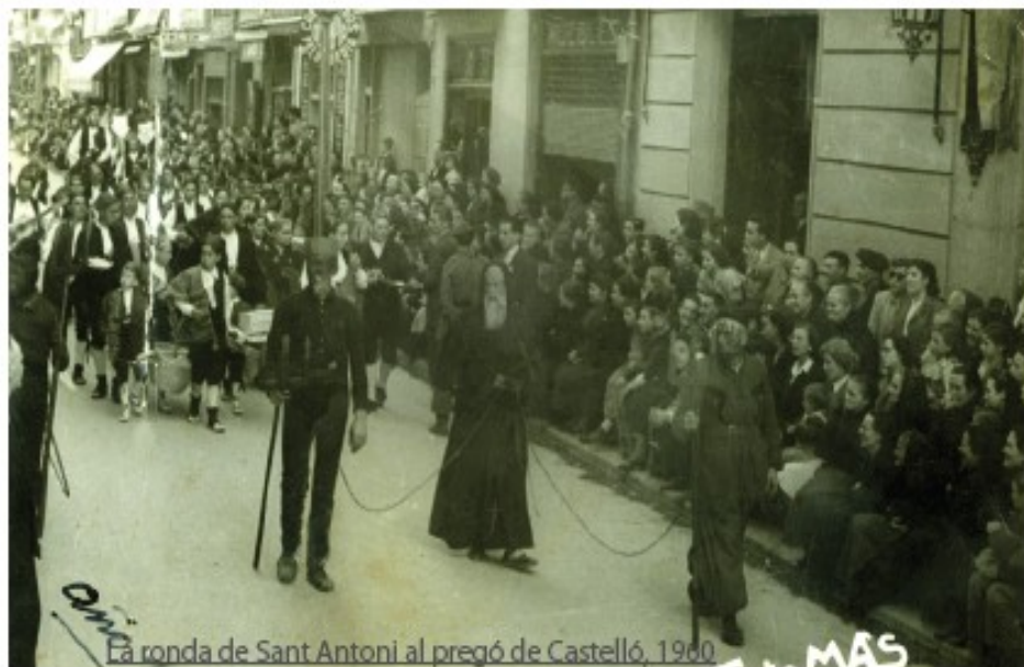
La ronda de Sant Antoni al pregó de Castelló, 1960

havia desaparegut, Sant Antoni. Trenta anys després no es pot fer altra cosa que donar-los les gràcies als recuperadors de la festa.